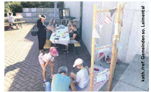
kath./ref. Gemeinden so. Leimental

MW: Die Ökumene ist sicherlich ein ganz zentraler Punkt für die Zukunft der Kirche. Wir erleben das hier bei uns im Kleinen. Gemeinsam im Dialog und dem, was sich daraus entwickelt, sind wir sichtbar und kommen weiter als jede und jeder für sich. Das Jubiläumsfest vom kommenden Wochenende zeigt das aufs Schönste.