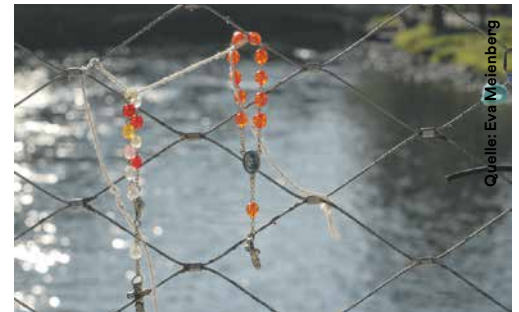
Rosenkränze mit Bernadettes Bild hängen an der Brücke über dem Fluss Gave.

Der Höhepunkt eines jeden Lourdestages ist die Lichterprozession um 21 Uhr. Hunderte Menschen versammeln sich dazu neben dem Platz vor der Grotte. Viele Freiwillige sind nötig, um die Menschen an die richtigen Stellen zu dirigieren. Die Prozession wird von einer leuchtenden Mariafigur hinter Glas angeführt. Der Statue auf der Sänfte, die von vier Männern getragen und von vier Ordensfrauen mit Stablaternen flankiert wird, folgen Priester, Ordensleute und Pilgergruppen. Hinter ihnen reihen sich Hunderte Menschen ein. Alle halten eine Kerze in der Hand, singen die ihnen vertrauten Melodien mit dem Text in ihrer Sprache. Ein polyglotter Gesang begleitet die