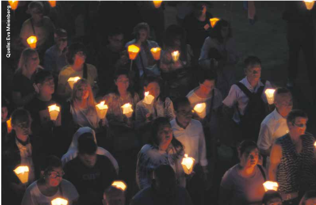
Jeden Abend findet die Lichterprozession vor der Rosenkranz-Kathedrale in Lourdes statt.

den. Die Hoffnung der Wallfahrenden nach Heilung ist begründet. Immerhin sind in Lourdes 70 Heilungswunder von der katholischen Kirche offiziell anerkannt. Tausende mehr sollen sich ereignet haben.