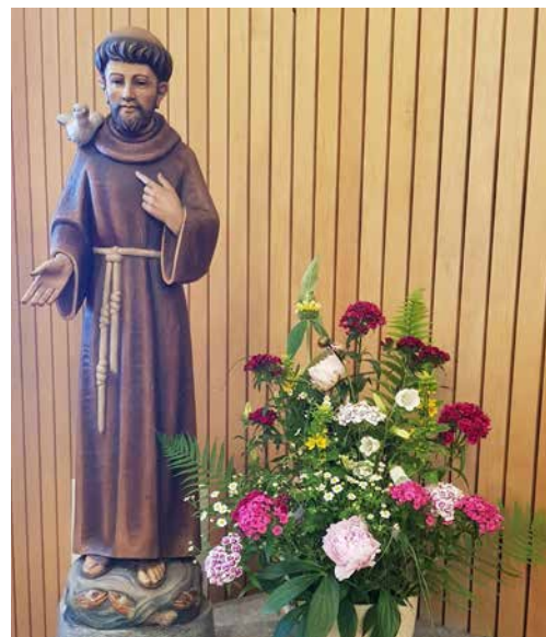
Eucharistiefeier in St. Franziskus Schinznach-Dorf am Sonntag, 13. Oktober um 11 Uhr

In Windisch wird darum an diesem Sonntag kein Gottesdienst stattfinden, für einmal rücken wir zusammen und feiern miteinander.