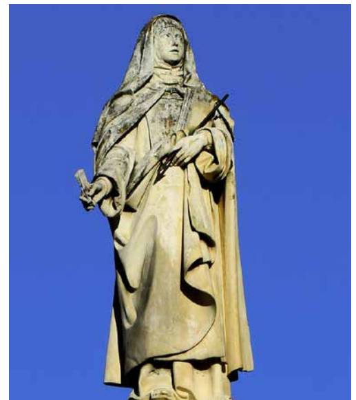
Denkmal der heiligen Teresa in Avila

Doch trotz all dem wurde sie schon im Jahr 1622, also 40 Jahre nach ihrem Tod heiliggesprochen. Und auch heute sind ihre Texte noch sehr aktuell und helfen uns in unserem geistlichen Leben.