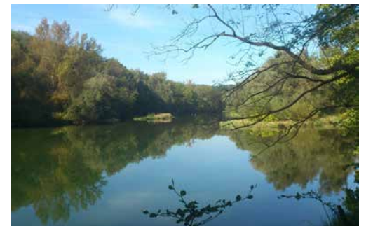
Aus Geschichten wie kostbare Perlen

Zu einem einsamen Mönch kamen eines Tages Menschen. Sie fragten ihn: «Was für einen Sinn siehst du in deinem Leben der Stille?» Der Mönch war eben beschäftigt mit dem Schöpfen von Wasser aus einer tiefen Zisterne. Er sprach zu seinen Besuchern: «Schaut in die Zisterne! Was seht ihr?» Die Leute blickten in die tiefe Zisterne. «Wir sehen nichts.» Nach einer kurzen Weile forderte der Einsiedler die Leute wieder auf: «Schaut in die Zisterne! Was seht ihr?» Die Leute blickten wieder hinunter. «Ja, jetzt sehen wir uns selber!» Der Mönch sprach: «Schaut, als ich vorhin Wasser schöpfte, war das Wasser unruhig. Jetzt ist das Wasser ruhig. Das ist die Erfahrung der Stille: Man sieht sich selber!»