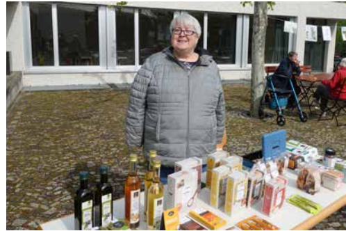
Termin zum Vormerken Sonntag, 18. Oktober