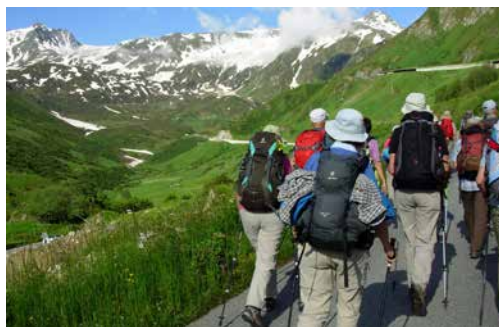
Freitag, 11. Oktober – Foto: Disentis – Andermatt 2019

Auf dieser letzten Etappe sind wir im Grenzgebiet unterwegs, wo Hugenotten und Waldenser unter oft sehr schwierigen Bedingungen auf die Entscheide der Behörden warten mussten!