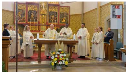
Bischof Martin Happe feiert die Messe in Spreitenbach

(Den vollständigen Text von Silvan Beer finden Sie auf www.kathspreitenbach.ch )