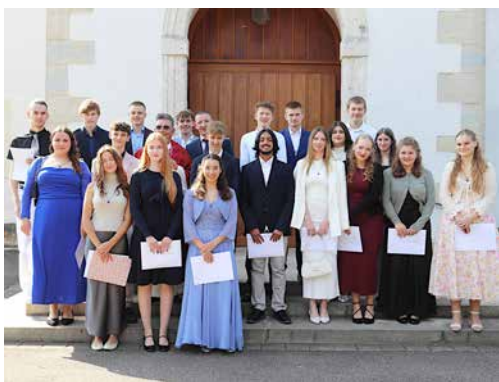
Oben: Firmandinnen und Firmanden vom 14. September - Unten: Firmandinnen und Firmanden vom 22. September