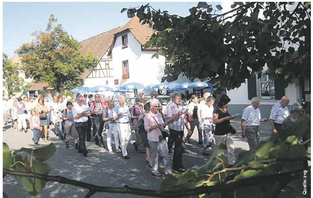
Mit dem Pilgerlied von Silja Walter ziehen die Pilgerinnen und Pilger in Mariastein jedes Jahr vom Klosterplatz bis vor die Basilika.