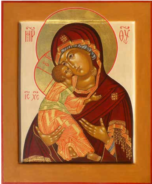
Ikone gemalt von Monika Deschler