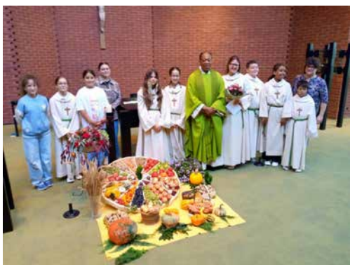
Impressionen vom Erntedank in Böttstein und Kleindöttingen