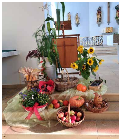
Fotos: Erntedankgottesdienst in Leibstadt