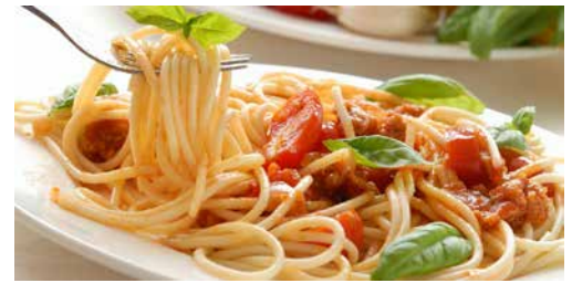
Jungwacht und Blauring Leuggern freuen sich auf Ihren Besuch!

In Leuggern besteht nach wie vor die Möglichkeit sich dieser Gebetskette anzuschliessen. Wer diese Anliegen unterstützen möchte, ist Donnerstags um 19 Uhr herzlich zum Gebet eingeladen.