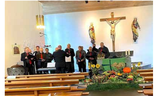
Foto: Erntedank- und Betttagsgottesdienst in Schwaderloch