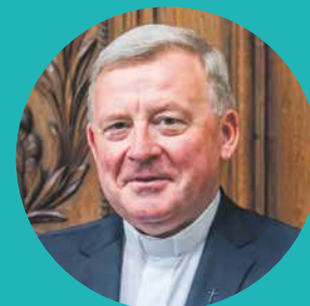
Josef Stübi Weihbischof im Bistum Basel

«Lichtblick». Ist dieses Doppelwort ein Name oder ein Programm – oder beides? Jedenfalls ein gutes Wort für das, worum es hier geht. Ich beginne darüber nachzudenken an einem kleinen, stillen See mit unberührtem Ufer, hell beschienen durch das weiche Licht der Sonne, welches die Schönheit dieser Umgebung zum Leuchten bringt. Es ist dasselbe Licht, welches schattige, dunkle Stellen erkennbar macht und somit ebenfalls in den Blick rückt. Ein sprechendes Bild. Hell und Dunkel sind überall – finden sich in Leben, Gesellschaft und Kirche. Um beides in Kommunikation und Berichterstattung in rechter Weise voneinander zu unterscheiden und einzuordnen, braucht es einen verständigen, klugen Blick. Vielleicht auch einen Zweiten oder Dritten. Ich wünsche «Lichtblick» diesen verantwortungsvollen Blick. Denn ein kompetenter, umsichtiger und sachgerechter Journalismus ist hilfreich, um Gegenwärtiges aufzuzeigen und damit den Weg in die Zukunft zu erhellen – für Kirche und Gesellschaft. Ich sehe «Lichtblick» – neben seiner Funktion als Informations- und Kommunikationsplattform für Pfarrei und Pastoralraum – nicht zuletzt auch als Ort theologischer Reflexion. Ein spannendes und aktuelles Aufgaben- und Betätigungsfeld. Ich danke allen, die sich für dieses Projekt eingesetzt haben, und wünsche, dass sein Erscheinen ein wirklicher Lichtblick sein möge.