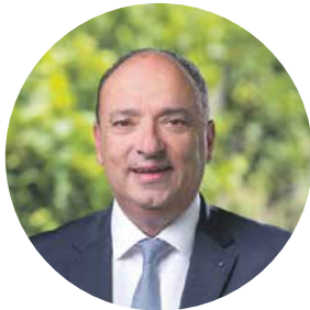
Markus Dieth Regierungsrat, Landammann Kanton Aargau

Meine herzliche Gratulation zum neuen Pfarrblatt «Lichtblick Nordwestschweiz». Der Zusammenschluss der Pfarrblätter der Nordwestschweiz ist ein sinnvoller Schritt: Die Region ist geografisch, politisch und auch kirchlich in sich verbunden. Zudem endet die Frohe Botschaft nicht an den Kantonsgrenzen. Ich wünsche eine erbauliche Lektüre und den Herausgebern viel Freude bei der weiteren Umsetzung des Pfarrblatts. Ich bin schon auf die nächsten Ausgaben gespannt.