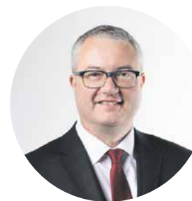
Dr. Remo Ankli Regierungsrat Kanton Solothurn

Die heutige Zeit hält viel von Transparenz und allenthalben wird der Anspruch auf Information geltend gemacht. Zudem gilt es für eine massgebliche Institution, wie die Kirche eine ist, sich auf dem modernen Markt der Aufmerksamkeit zu behaupten. Und nicht zuletzt ist es vorteilhaft, wenn das segensreiche Schaffen zugunsten der Allgemeinheit sichtbar gemacht werden kann. In diesem Sinne wünsche ich dem «Lichtblick Nordwestschweiz», dass er sämtliche Erwartungen erfüllen kann, die sich mit seinem Erscheinen verbinden.